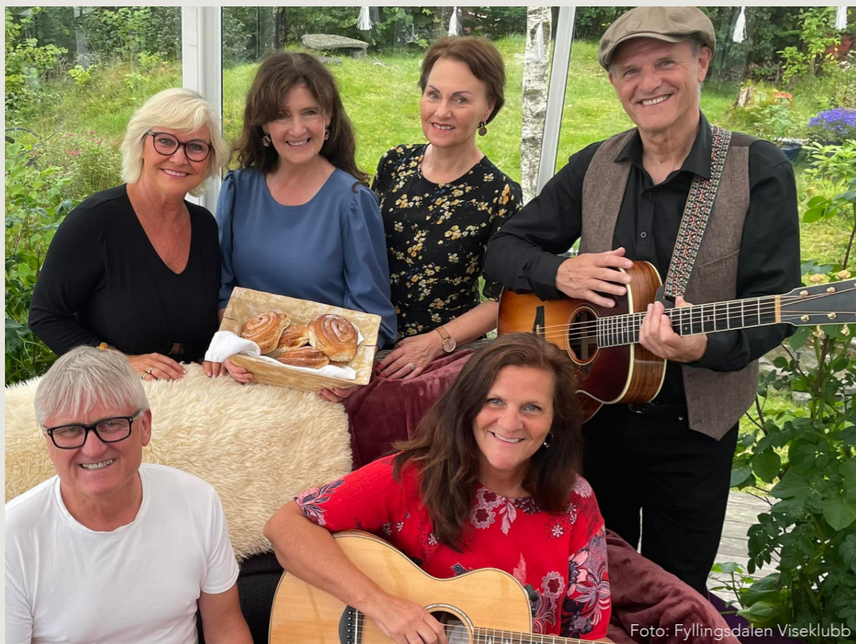
Fyllingsdalen Viseklubb så dagens lys under koronapandemien, nov. 2012, og har siden vært i full fart!

Det ble også formidlet 140 000 kr i Frifondmidler til medlemslag med unge medlemmer under 26 år. Tilskudd ble utbetalt til 8 medlemslag.